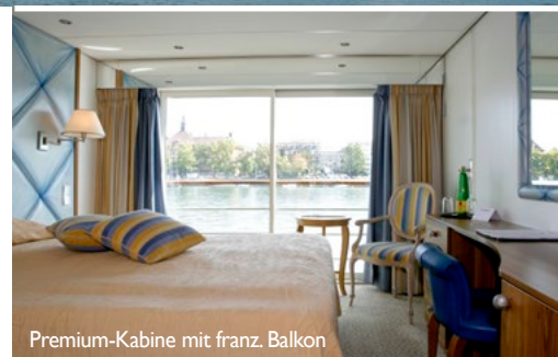
Premium-Kabine mit franz. Balkon

Die MS Johann Strauss bietet Reisekomfort der höchsten Güte. Das Schiff verfügt über Lobby/Rezeption, Panoramalounge mit Bar, Panoramarestaurant am Heck, Bibliothek sowie Dampfbad- und Fitnessbereich. Das weitläufige Sonnendeck ist mit Sonnensegeln, Sitzgelegenheiten und Liegestühlen ausgestattet und bietet viel Platz für Ruhe und Entspannung. Alle Kabinen sind Außenkabinen. Die Premiumkabinen (15 m 2 ) und Suiten (19,5 m 2 ) auf dem Donau-Deck verfügen über französische Balkone (zu öffnen). Auf dem Rheindeck sind die Deluxe-Kabinen (15 m 2 ) mit semi-französischen Balkonen (zu öffnen), die Junior Suiten (18 m 2 ) und Standard-Kabinen (15 m 2 ) mit nicht zu öffnenden Panoramafenstern ausgestattet. Die Kabinen auf dem Mosel-Deck sind etwas kleiner (12 m 2 ) und haben nicht zu öffnende, kleinere Fenster. Alle Kabinen verfügen über regulierbare Klimaanlage, Dusche und WC, SAT-TV, Flachbildschirme, zwei Betten (wahlweise zusammen oder getrennt, am Mosel-Deck nur getrennt möglich), Schränke, Haartrockner und Telefon.